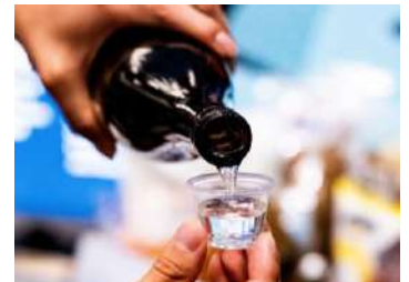
試食・試飲一ロサイズ・イメージ