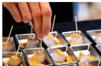
試食・試飲一口サイズ・イメージ